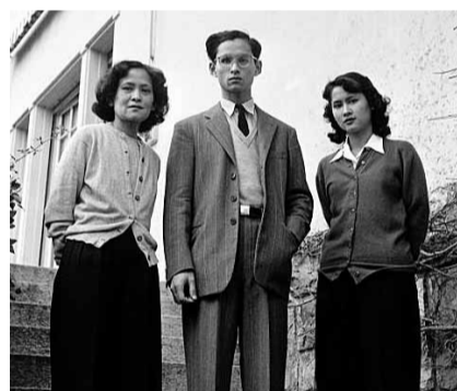
Le roi sur l'escalier de la Villa Vadhana qu'il a occupée à Pully.