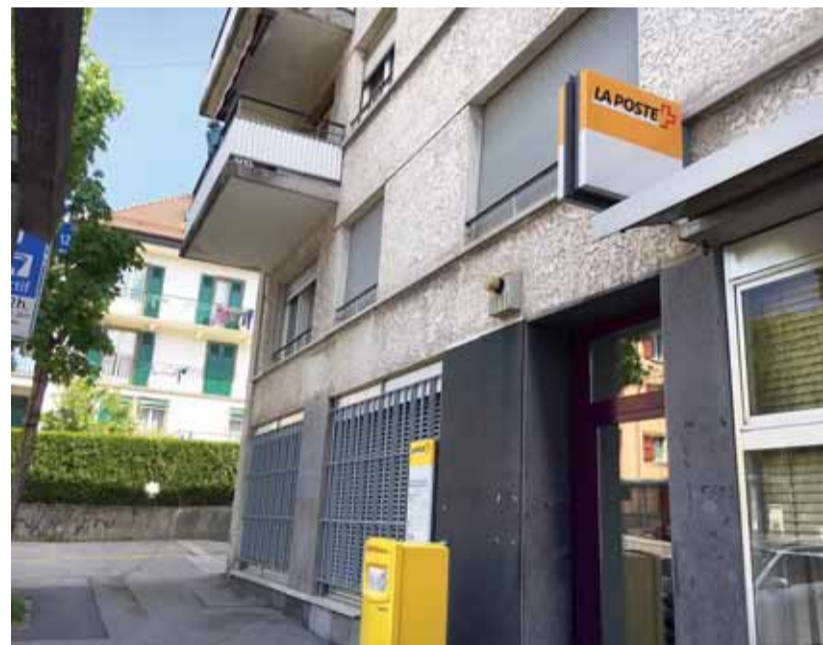
La Poste n'a pas encore pris la décision formelle de fermer le bureau de Bellevaux, mais des indices concordants poussent à le croire. PK