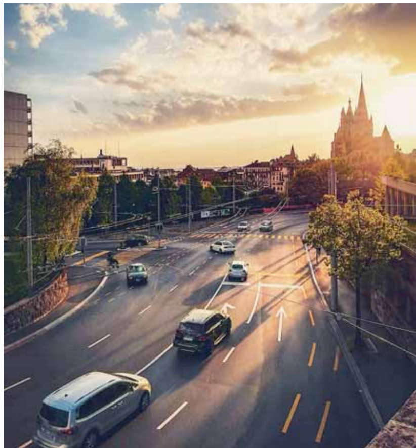
Le choix de Luca (@diuck73): La cathédrale en contre-jour superbement mise en valeur par la belle lumière chaude de l'heure dorée en fin de journée. @AGGELOS_BIBOU