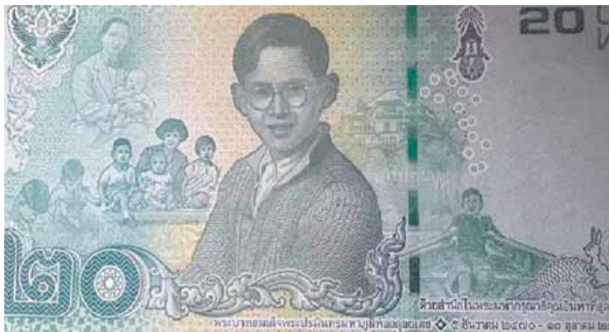
Sur ce nouveau billet de 20 baths, on peut voir le roi Bhumibol ramer sur le lac de Bret et la Villa Vadhana que la famille royale a occupée à Pully.

Alors que le nouveau Rama X figure depuis le 6 avril sur les nouveaux billets, d'autres coupures imprimées à son décès montrent